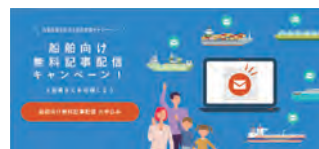
船舶向け記事配信 (2022年5月までは無料配信)

海運・物流業界が取り組むSDGs(持続可能な開発目標)の一翼として、船陸間の情報差解消を目指す記事配信を実施。厳しい状況下でも船を動かす船員を、ニュース提供の側面から支援します。