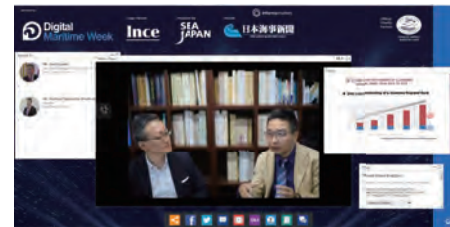
日英同時配信「MariTech Webinar Japan」(左) 全世界で実施の「Digital Maritime Week」に参画(上)